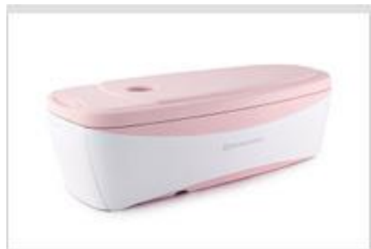
乳房専用 PET Elmammo